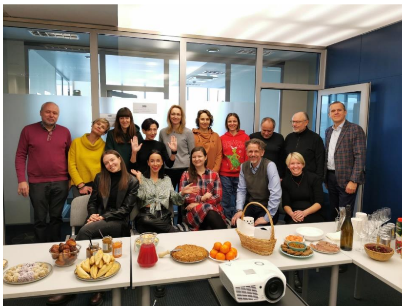
EKT kalėdinis aukcionas